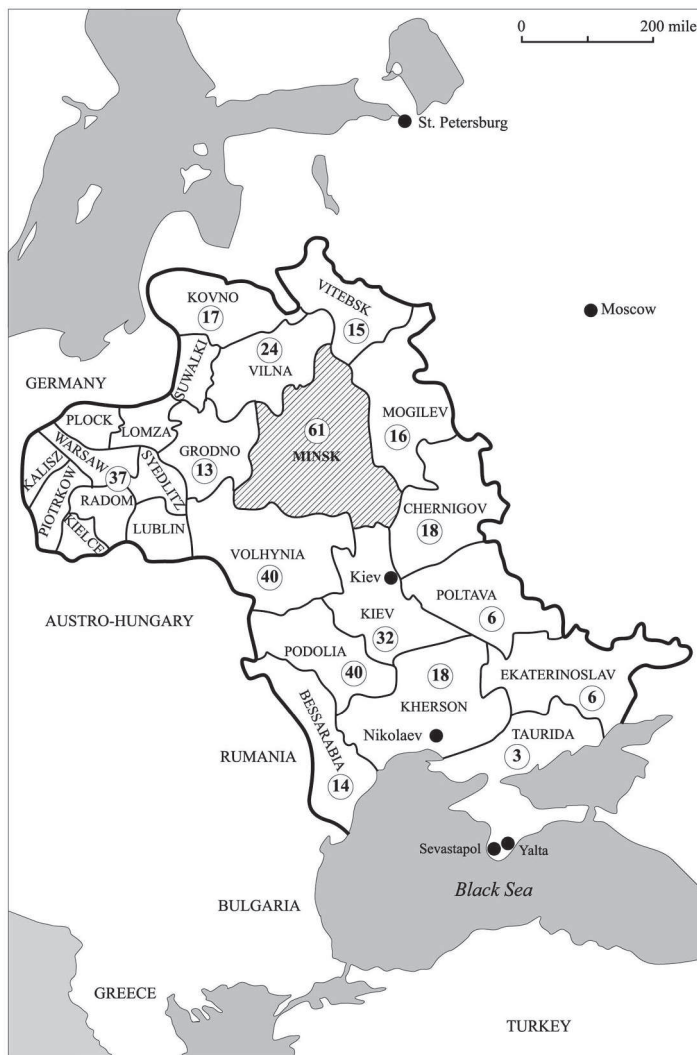
מפה 1: פיזור לשכות המודיעין של יק"א בתחום המושב היהודי, בשנת 1909

הערה: המספרים בעיגול מתייחסים למספר השכות בכל פלך. מקורות: דער יודישער עמיגראנט: 15 בינואר 1909, גיליון 1, עמ' 16; 31 בינואר 1909, גיליון 2, עמ' 15; 2 במרץ 1909, גיליון 4, עמ' 12; 16 במרץ 1909, גיליון 5, עמ' 5; 3 באפריל 1909, גיליון 6, עמ' 4; 15 באפריל 1909, גיליון 7, עמ' 12; 14 באוגוסט 1909, גיליון 15, עמ' 13; 1 בספטמבר 1909, גיליון 16, עמ' 13; 15 בנובמבר 1909, גיליון 21, עמ' 17; 1 במאי 1910, גיליון 8, עמ' 14; 30 במאי 1910, גיליון 10, עמ' 22.